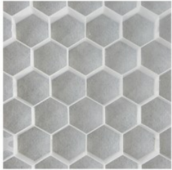
Nidagravel 129 blanc 120x80x2,9cm