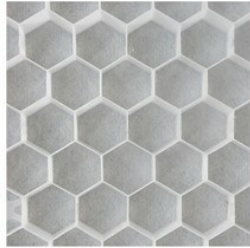
Nidagravel 130 blanc 240x120x3 cm